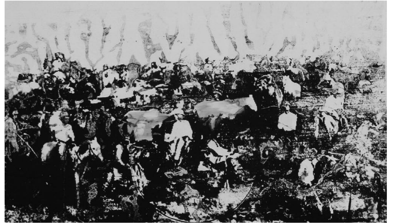
COWBOY: WORK | 150 x 90 CM | 2009 | SILKSCREEN ON MDF