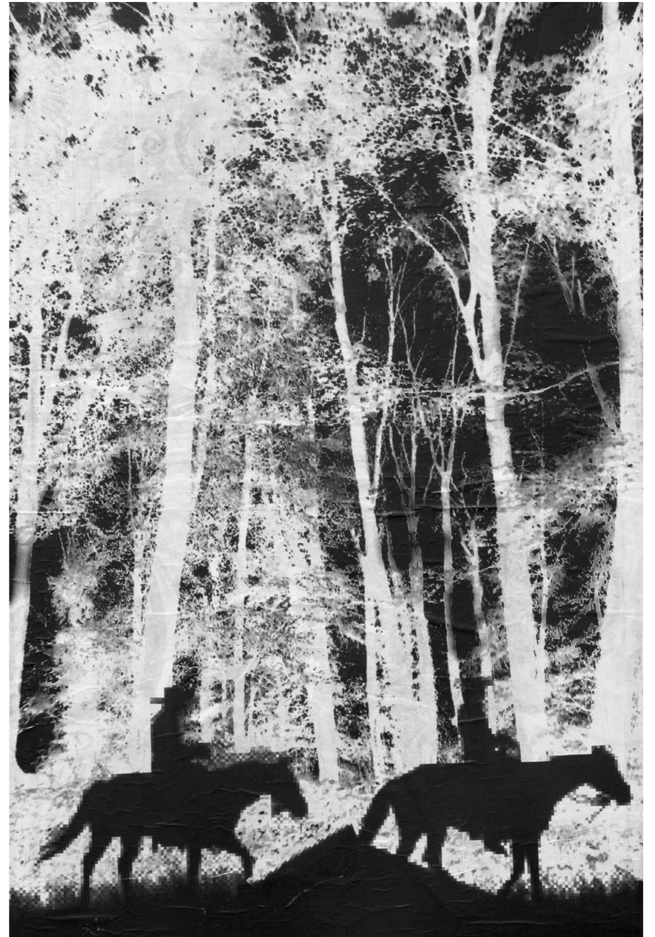
COWBOY: TREK | 150 x 100 cm | 2009 | PAPER ON MDF