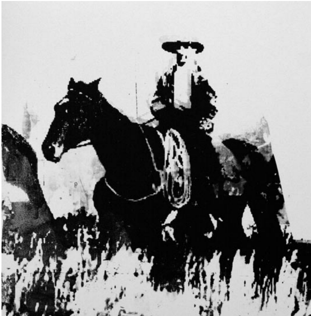
COWBOY: ??? | 150 x 100 cm | 2009 | SILKSCREEN ON CANVAS