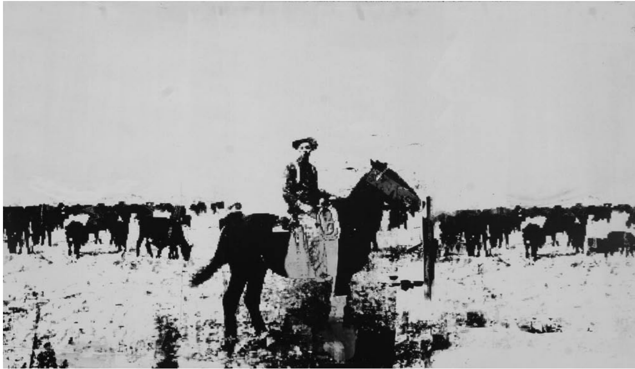
COWBOY: COWS & BOYS | 150 x 90 CM | 2009 | SILKSCREEN ON MDF