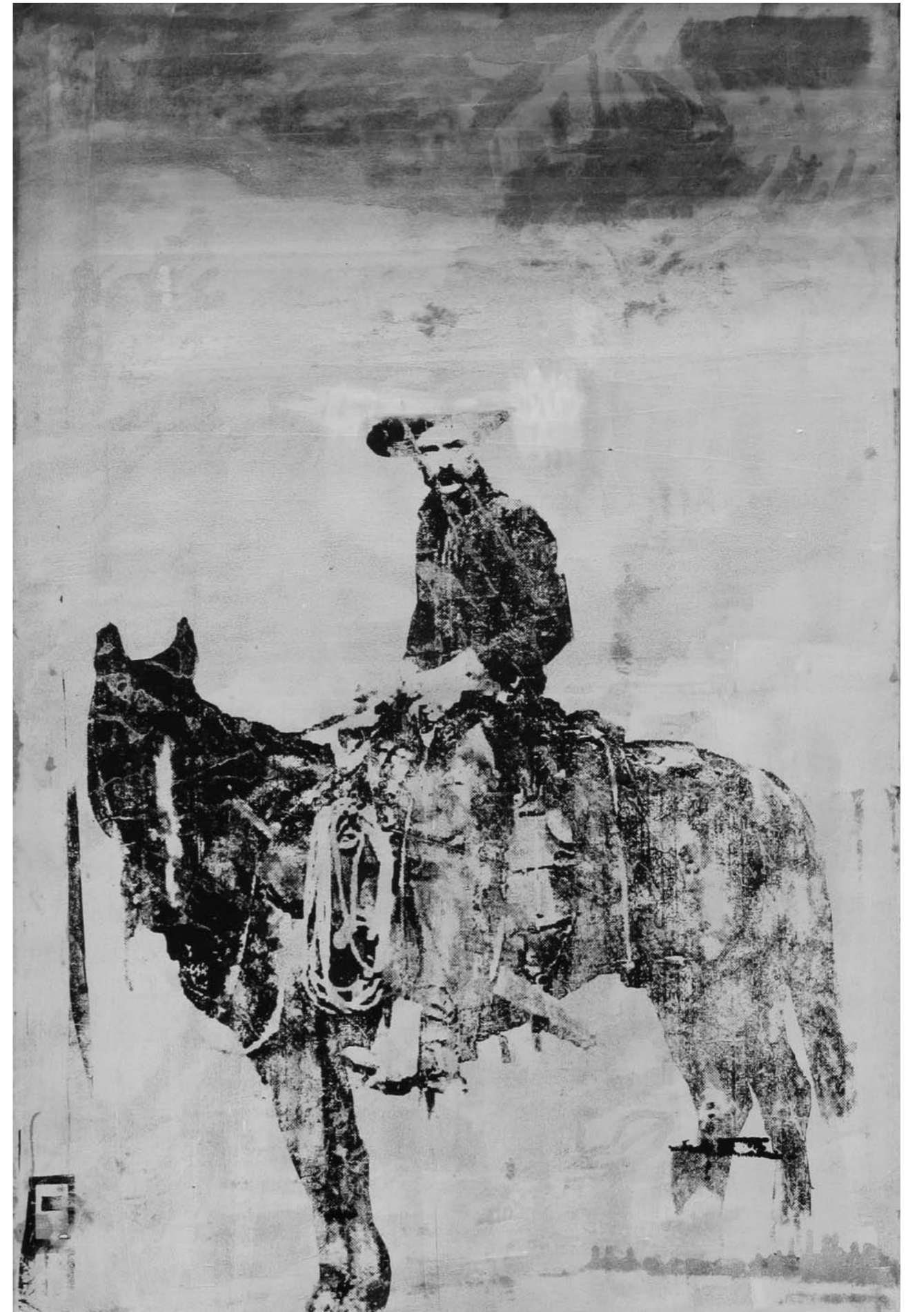
COWBOY: GLORY | 150 x 100 cm | 2009 | SILKSCREEN ON CANVAS